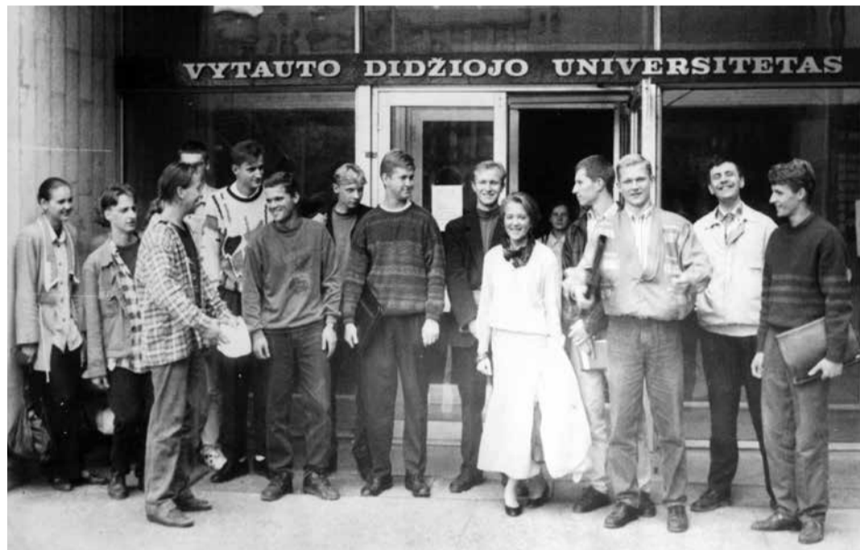
VDU studentai.

Ateities istorikai vertins šį dešimtmetį ne tik kaip Lietuvos „išsivaiškščiavimo“, bet ir universitetų „tuštėjimo“ metą – 2018–2019 mokslo metais universitetuose ir akademijose beliko 77 tūkst. studentų, o ateinančiais