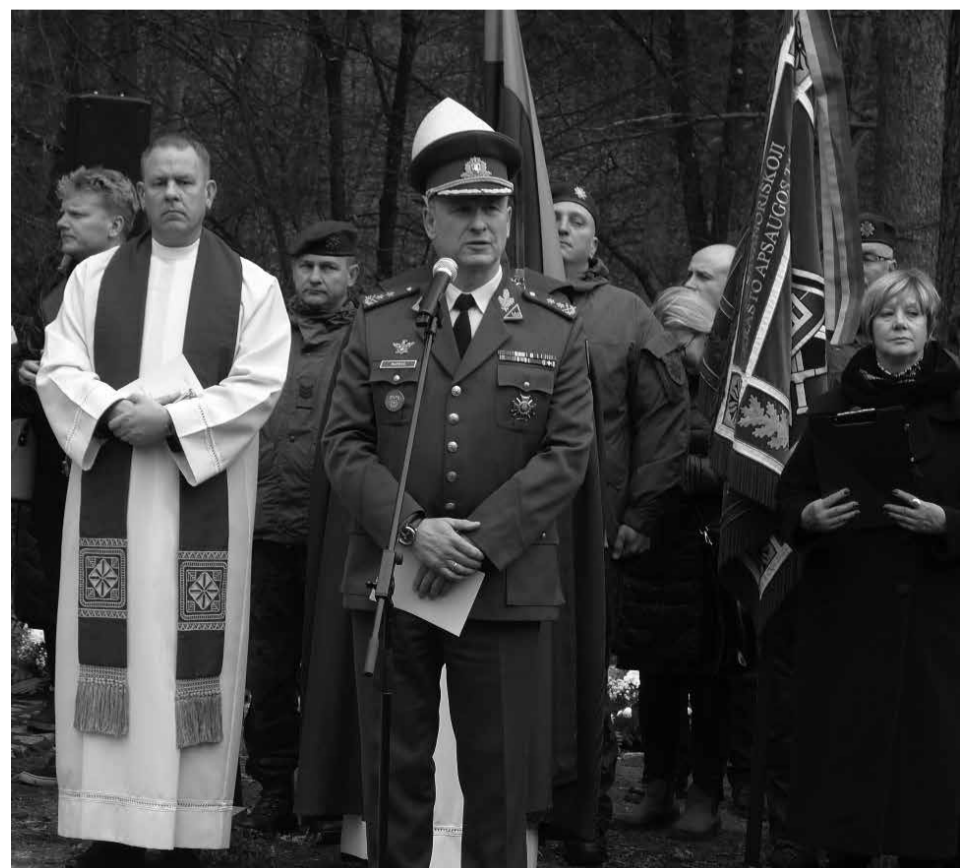
Kalba Lietuvos kariuomenės vadas