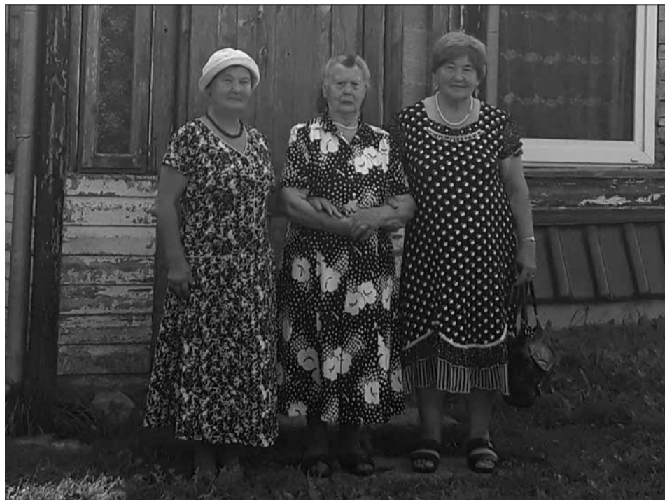
Anūkės prie senelio namo