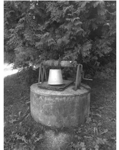
Šuliny, iš kurio gėrė kelios sodiečių kartos

...Ilgai Vincas tą naktį negalėjo užmigti. Pačiai pasakyti negali, vienas mintija, kaip tokį lobį išsaugoti. Gal į banką nuvežti: ten neprapuls, ir nauda bus. „Bet ne, į banką nevešiu“, – vos garsiai neištaria. Geriau peludėje arba po padlagom laikysiu. Kiekvieną dieną į puodynę spoksodamas, laimingas būsiu... Rytoj pat perku žemę. Gerą, derlingą, kurios seniai norėjau. Vyriausias sūnus Jonas ūkį pavaldės. Bus žmonių gerbiamas