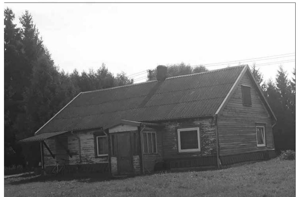
Senoji sodyba, nors ir nukentėjusi nuo laikmečio permainų, mena praėjusio šimtmečio pradžią