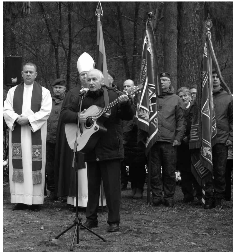
Atsiveikinimo giesmė.