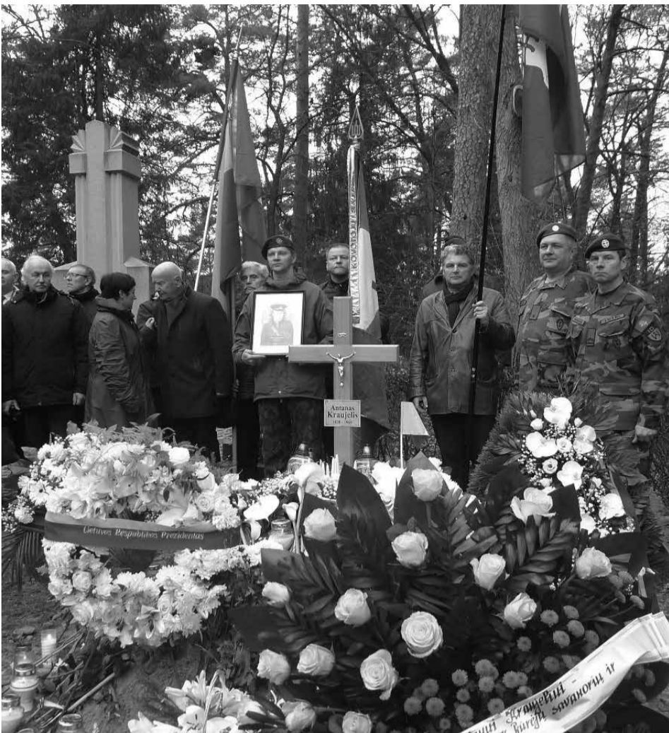
Antano Kraujelio amžinojo poilsio vieta Antakalnio kapinėse